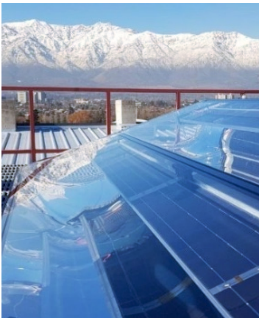
Etikininvest investerar i bland annat solenergi, bild på Solarus Sunpower hybridsolfångare, Chile

Investera för mänskligheten, världen och dig.